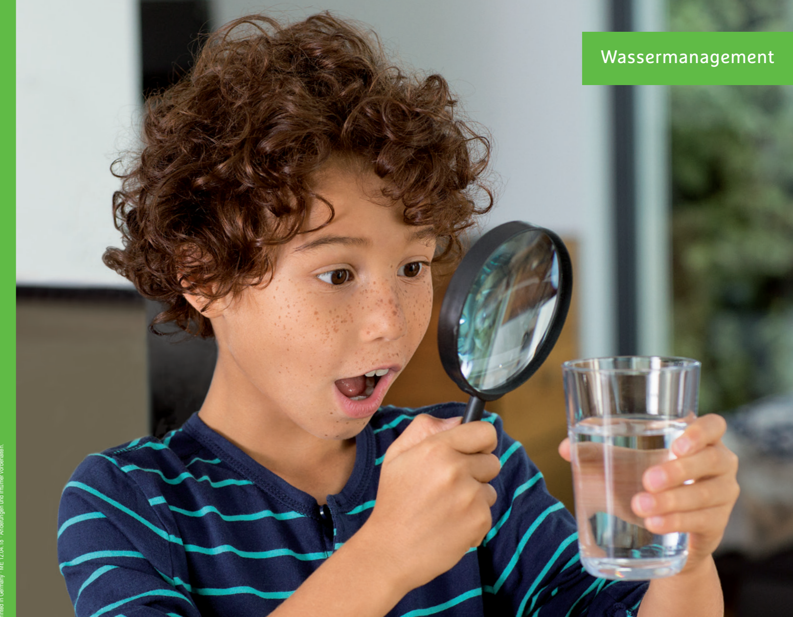
© Bielefeld: 625 12 010 (037656) | Printed in Germany | ME 13.04.18 | Änderungen und Irrtümer vorbehalten.